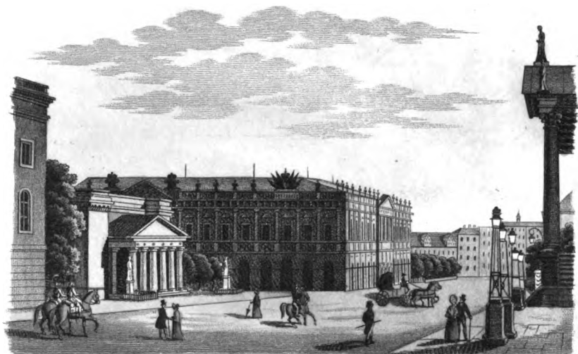
Die Königswache u. das Zeughaus in Berlin...

Desidero di umbrare al Nostro Augusto Signore questo catalogo, in cui trovano si- erate tutti i prodotti dell'Industria germanica esposti dal 15 di agosto fino al presente giorno nell'edifizio dell'arsenale. In questa mostra si vedono pure i nomi di tutte le provincie e questi divisi a seconda delle città, a cui appartengono. Non può esser inutile l'osservare che tal classazione sarebbe necessaria ancor per l'Industria che si occupa in un modo di tal natura che ed essere l'utile di benemerita le due ragioni più seguitate nelle loro operazioni politiche e testine.